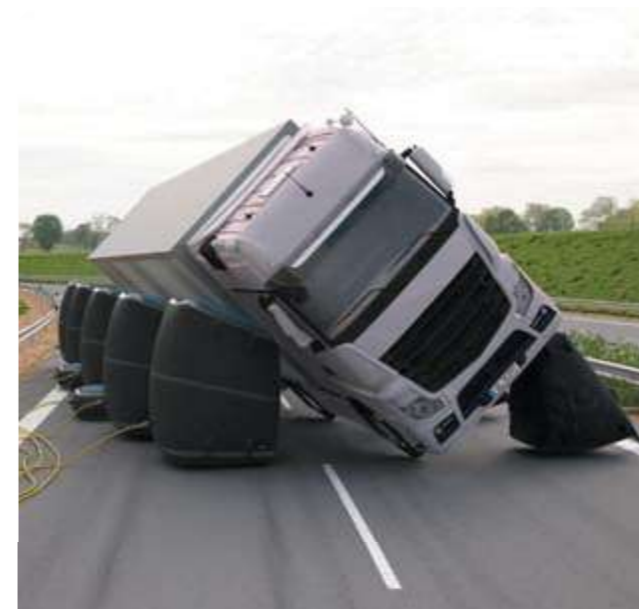
Подъем без дополнительных повреждений.