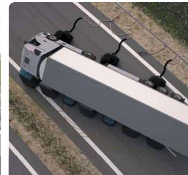
Быстрый и безопасный подъем.