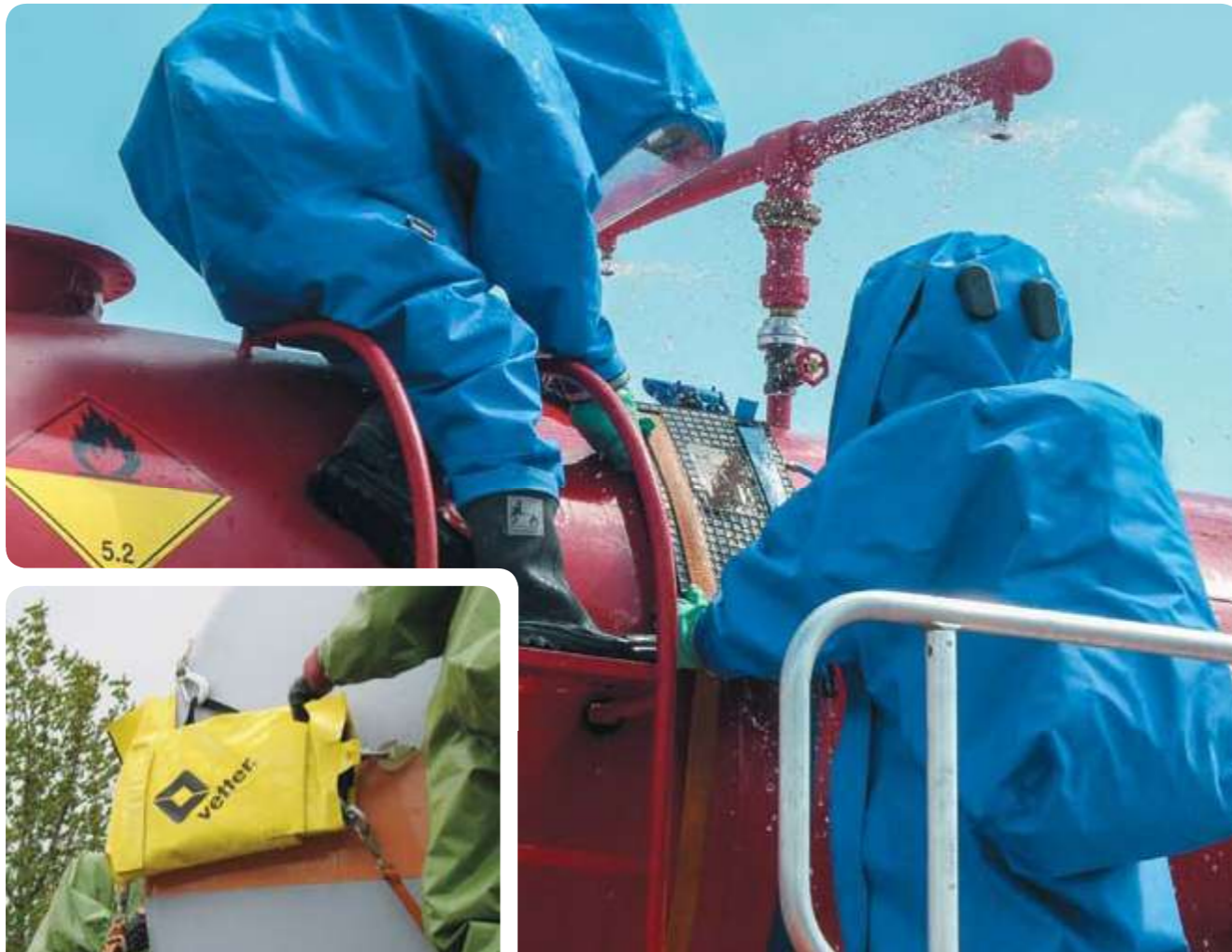
Защитный чехол от кислоты для безопасного использования и хранения.

При устранении утечки опасных жидкостей из резервуаров дорога каждая минута. Уплотняющие подушки фирмы Vetter быстро и легко надуваются с помощью ножного насоса. Благодаря равномерному распределению давления происходит надежная блокировка области утечки. Все уплотняющие подушки поставляются со специальным чехлом высокой степени защиты от кислоты, который может не сниматься при транспортировке и хранении.