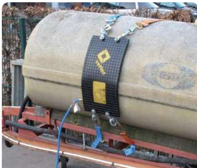
С вертлюжными проушинами