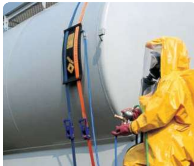
С прорезями для ремней