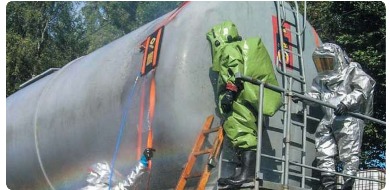
Надежное устранение утечки, благодаря специальным прорезям в уплотняющей подушке для фиксирующих ремней.

Уплотняющие подушки Vetter выпускаются в двух различных вариантах: