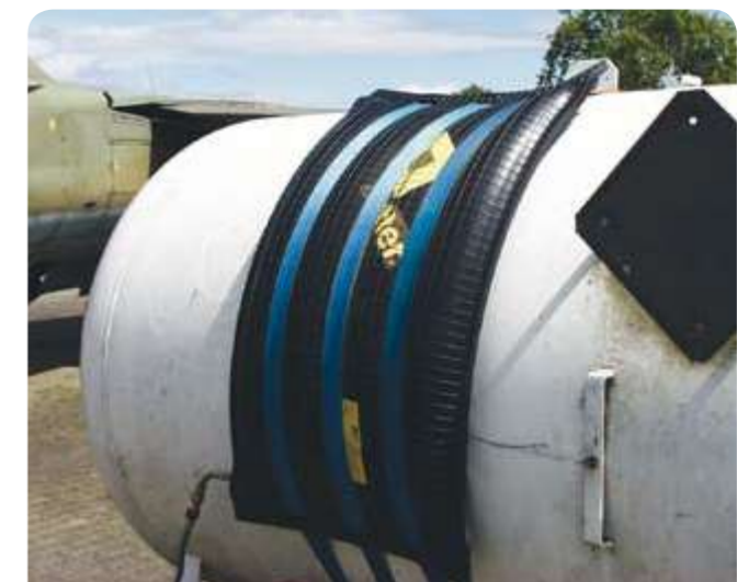
Уплотняющая подушка XL с большой областью перекрытия