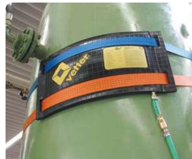
Уплотняющая подушка высокого давления (12 бар)