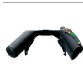
Головной дисплей Dräger FPS® 7000