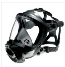
Dräger FPS® 7000