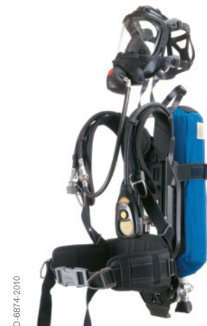
Dräger PSS® 5000