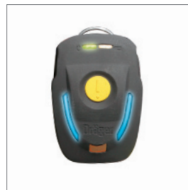
Dräger Bodyguard® 1000 Персональная система предупреждения и безопасности