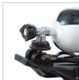
Быстроразъемное соедине- ние баллонов со сжатым воз- духом Dräger