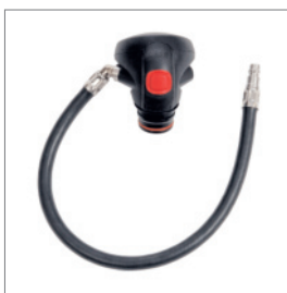
Легочные автоматы Dräger