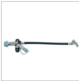
Второе соединение - принадлеж- ность для экстренного случая, спасательных и дезактивацион- ных работ