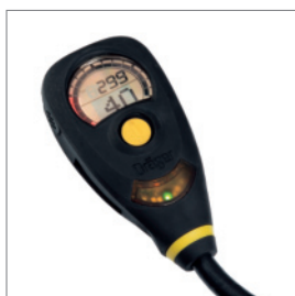
Dräger Bodyguard® 7000