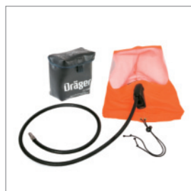
Капюшон спасаемого Dräger PSS