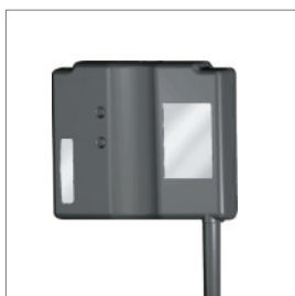
Модем Dräger PSS Merlin